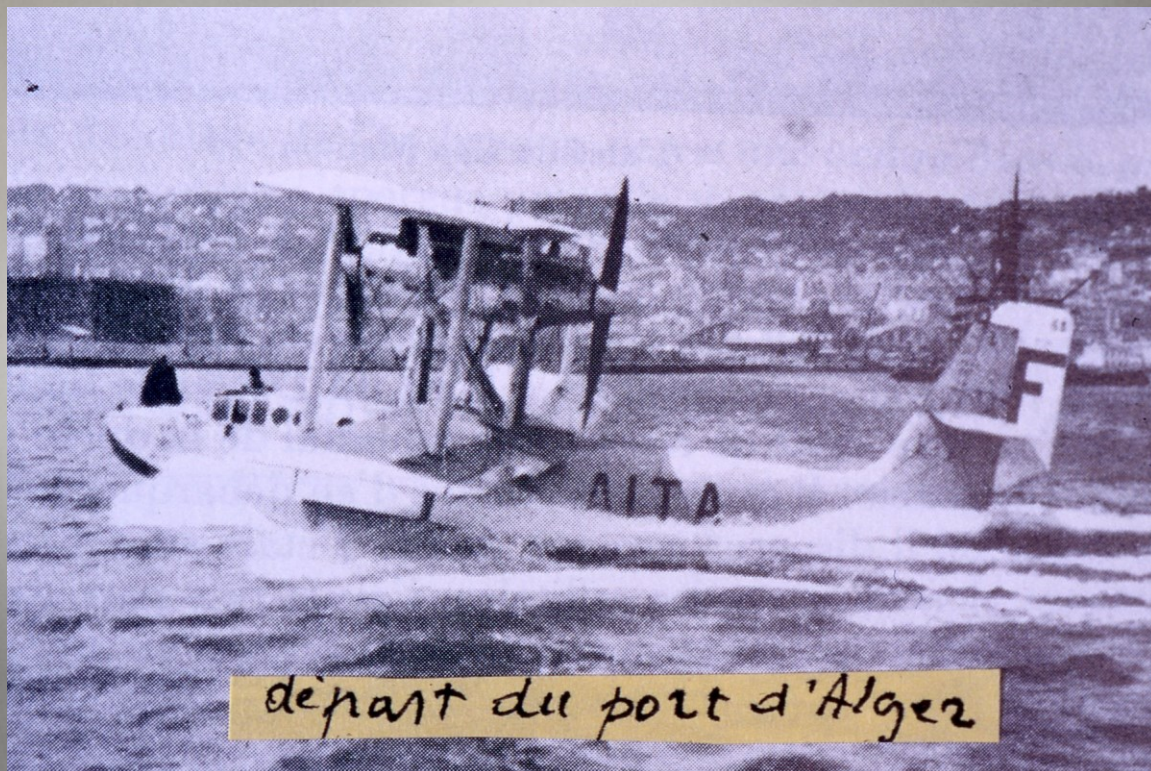
départ du port d'Alger