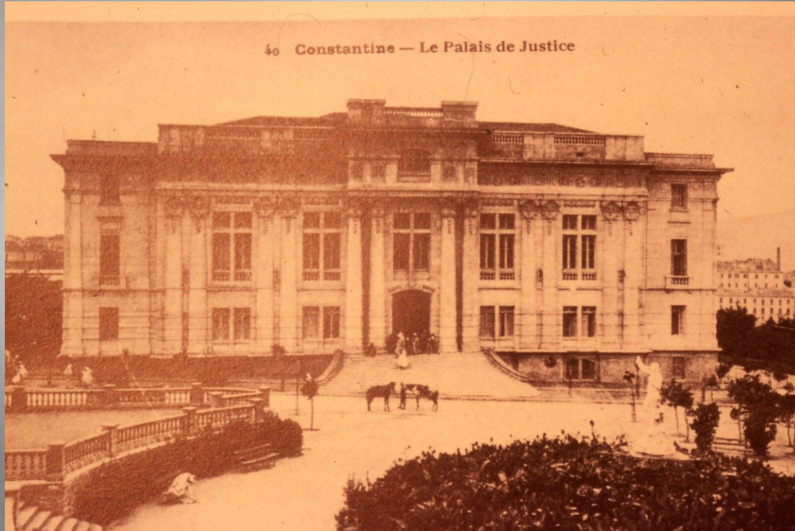
40 Constantine — Le Palais de Justice