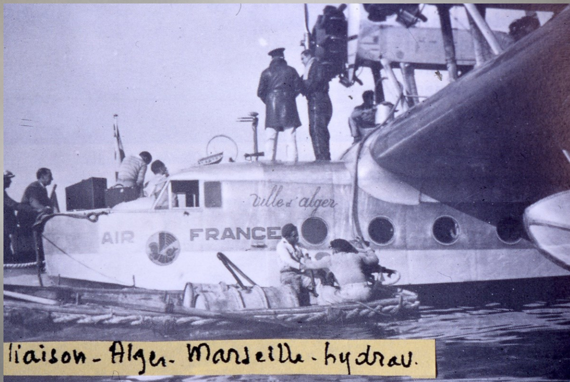
liaison - Alger - Marseille - hydroav.