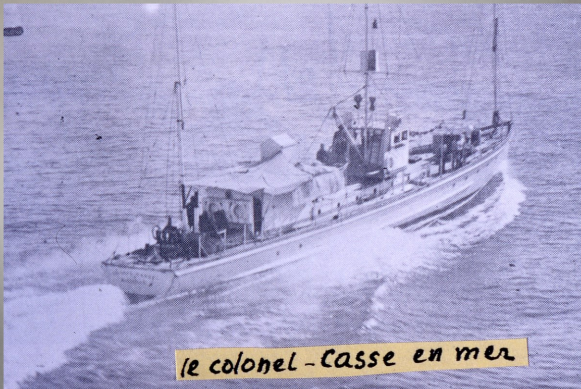
le colonel - Casse en mer