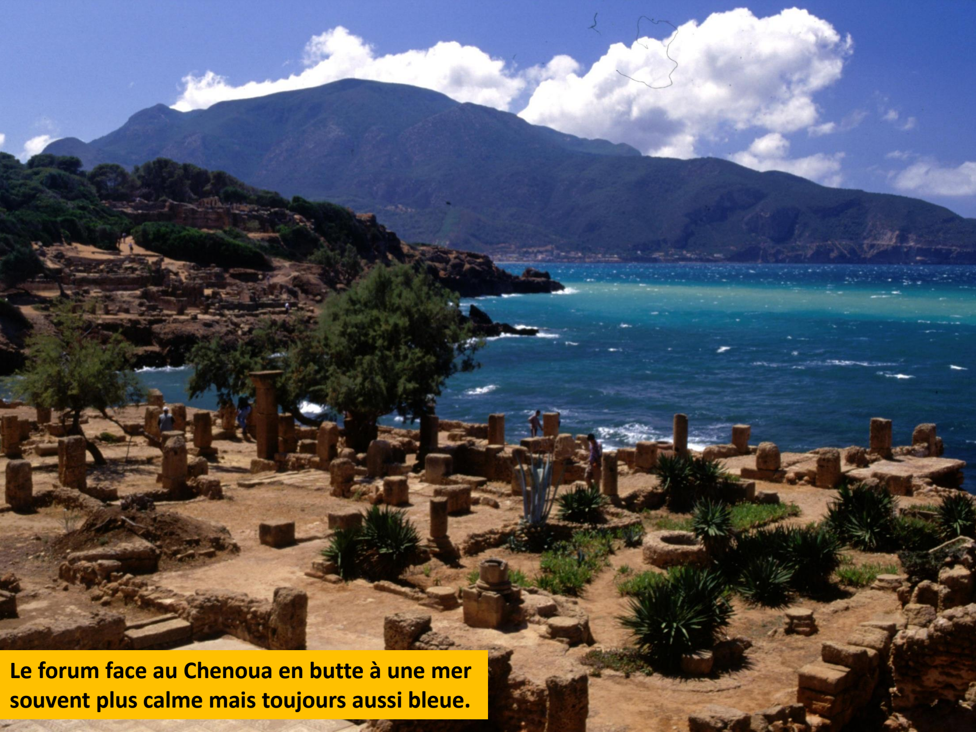
Le forum face au Chenoua en butte à une mer souvent plus calme mais toujours aussi bleue.