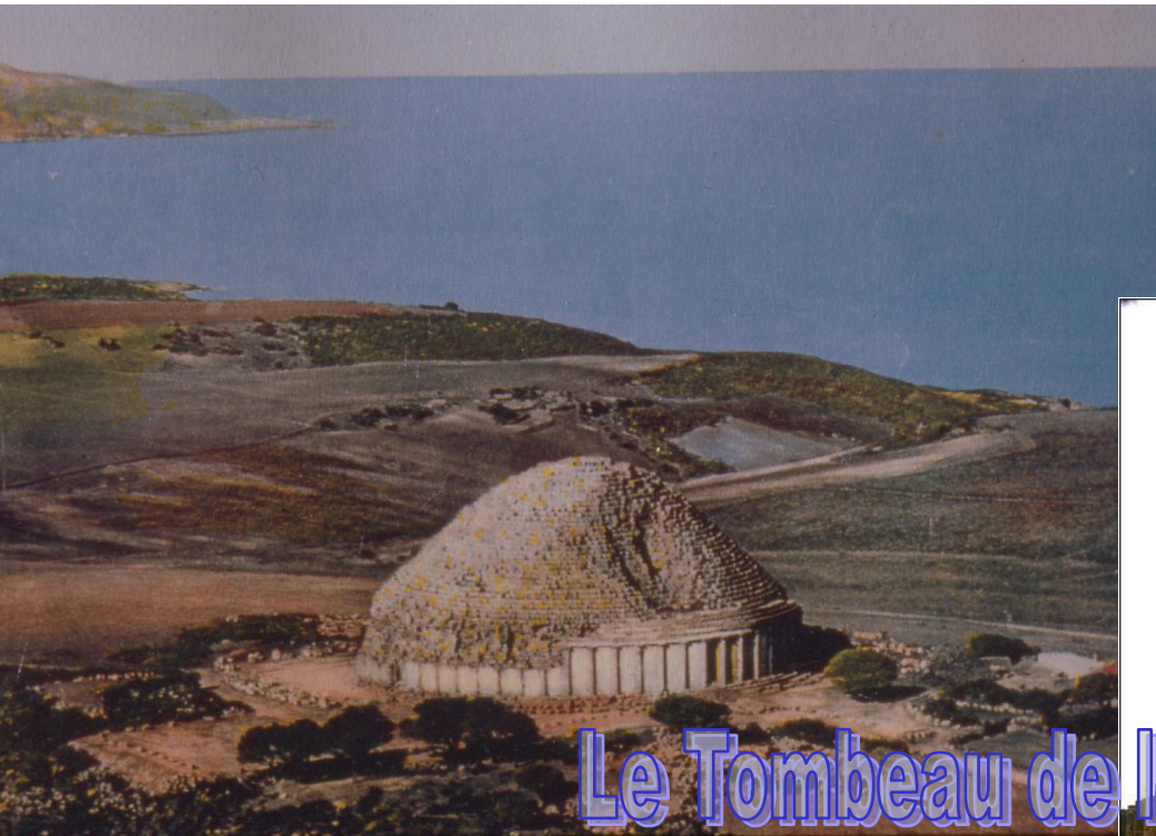
Le Tombeau de la Chrétienne