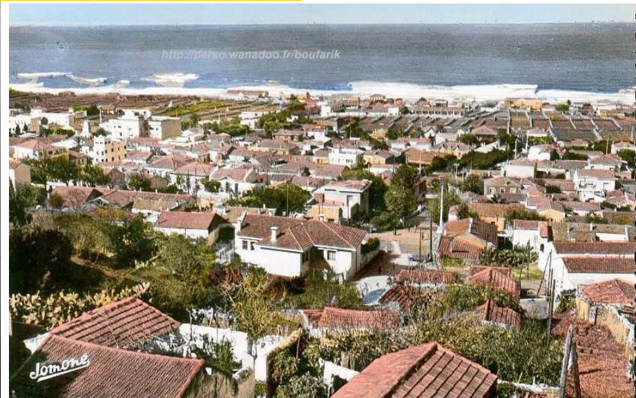
7. CASTIGLIONE — Le Boulevard